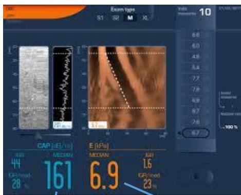
肝臓に貯まる脂肪量