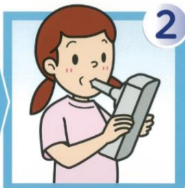
フィルタを通して最大吸気します