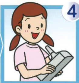
約1分40秒後に結果が表示されます